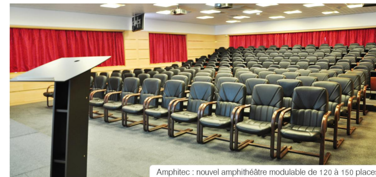
Amphitec : nouvel amphithéâtre modulable de 120 à 150 places