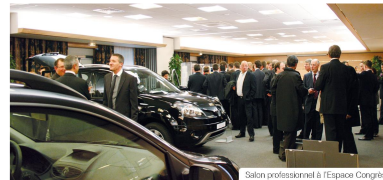
Salon professionnel à l'Espace Congrès