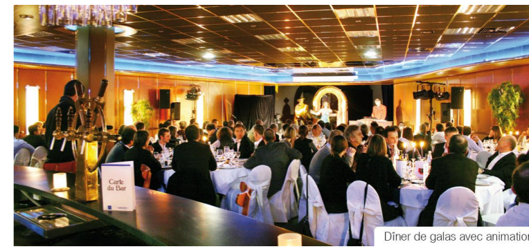
Dîner de galas avec animation