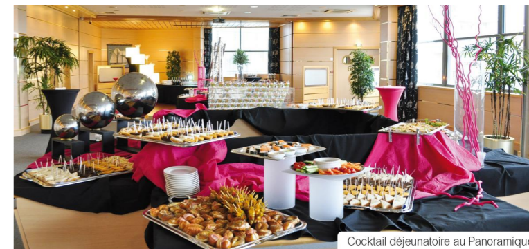
Cocktail déjeunatoire au Panoramique