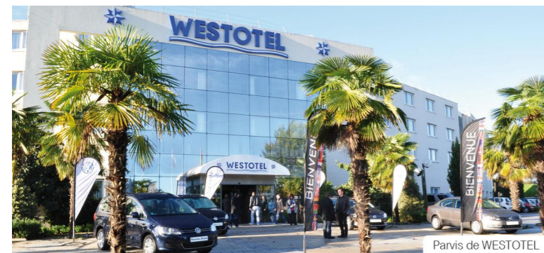
Parvis de WESTOTEL