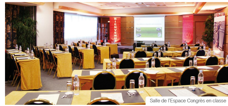
Salle de l'Espace Congrès en classe