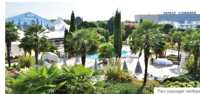
Parc paysager exotique

Journée : 52€ Semi-résidentiel single : 138€ Résidentiel single : 157€