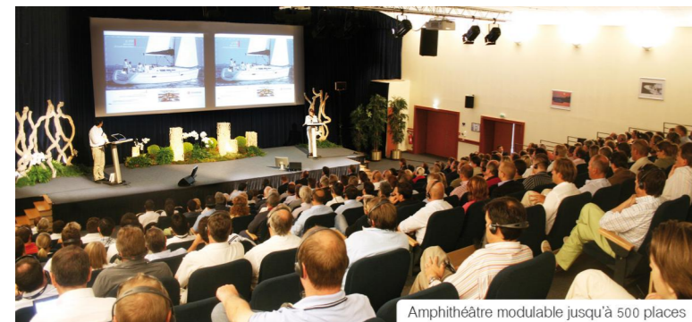
Amphithéâtre modulable jusqu'à 500 places